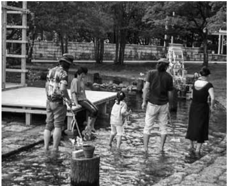
7月20日 流れ作り乍ら(川底みがき)