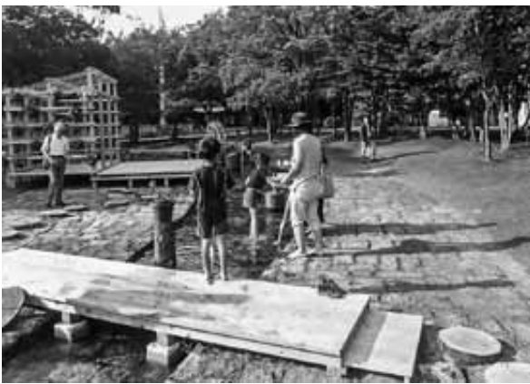
7月23日 流れ作り乍ら