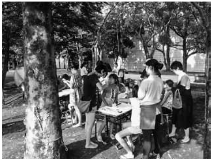
7月23日 流れ作り乍ら(花づくり)