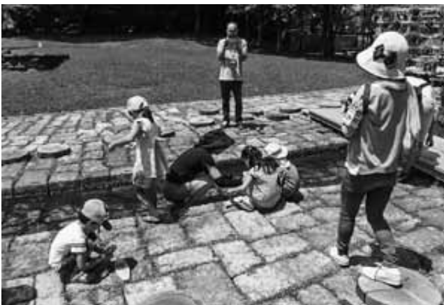
7月31日 ぎふの木でつくって浮かべてあそぼう