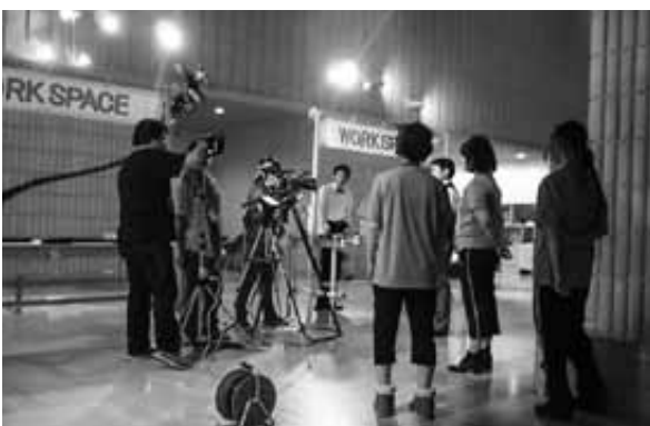
8月21日 収穫祭準備風景(自主映画)