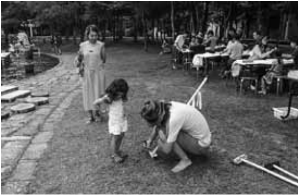
7月17日 流れ作り乍ら