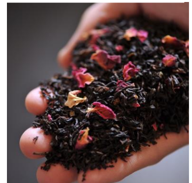
フレーバーティーのリーフ