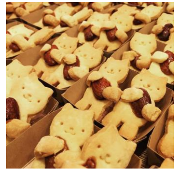
ちょいみせキッチンの特製猫クッキー （売り切れの場合があります）