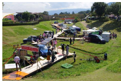
「アートまるケット 2018 Nadegata Instant 養老公園プロジェクトパーキング・プロムナード/Parking Promenade(2018)

「アートまるケット 2018 養老公園プロジェクト Parking Promenade」(2018)では、《養老天命反転地》を引用し、野外プロジェクトの可能性を示した解放感と機知溢れる体験型作品を、美術館の展示室に凝縮する。