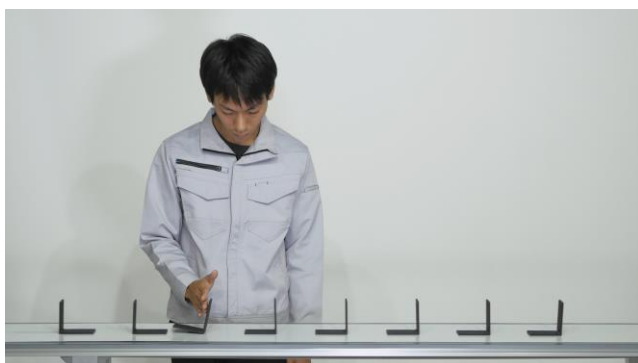
中路景暁 《Sequences/Consequences》 2019