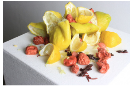
参考作品 《Pavlov's dog》2021年 アクリル、樹脂粘土・透明粘土