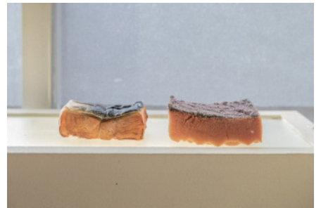
参考作品 《モシャス (焼鮎 甘口)》2018年 アクリル、樹脂粘土/職場で使用していたスポンジ