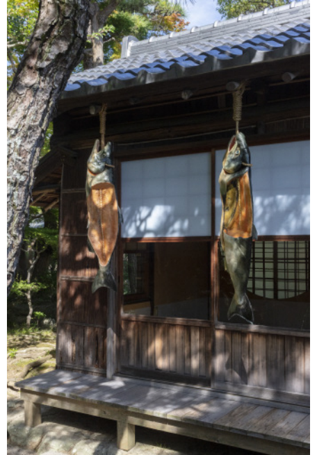
参考作品 《鮎s》2023年 アクリル、樹脂粘土・スタイロフォーム