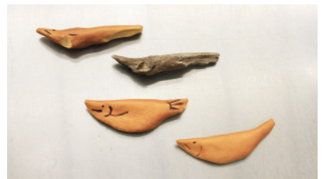
ワークショップ参考作品 《モシャス (鮎菓子)》2024年 アクリル、樹脂粘土/流木