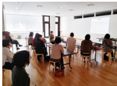
▲サポーター講座 10月20日 ファッションー KIMONO と現代