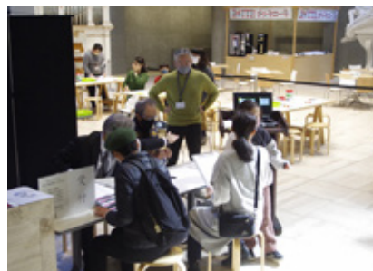
▲教育普及活動サポート 2月5日 アートアクション