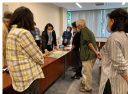
▲サポーター講座 5月12日 開館40周年記念日を前に