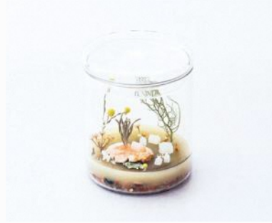
《私の物語を信じること》 2014年

アーティストはどうやって作品を作り出していくのだろうか？ どんな人が作っているのだろうか？ 作っている時何を考えているのだろうか？ 完成した作品を美術館で鑑賞するだけではわからない アートが生まれる瞬間を体験できたり、時には参加することができるのが アーティスト・イン・ミュージアム(AIM)。 美術館の中にアーティストのアトリエが出現します！