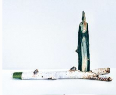
《水の折り 啓かれる森で》 2021年