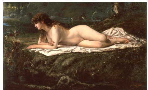
山本芳翠《裸婦》1880年頃 岐阜県美術館収蔵 【重要文化財】