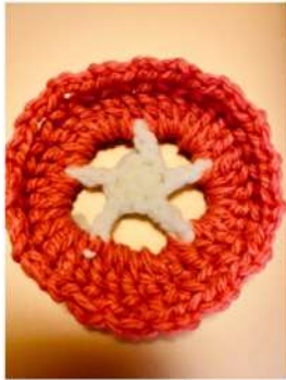
編みものできる人向け

●...引抜きあみ ○...くさりあみ ×...こまあみ T...長あみ F...長あみ