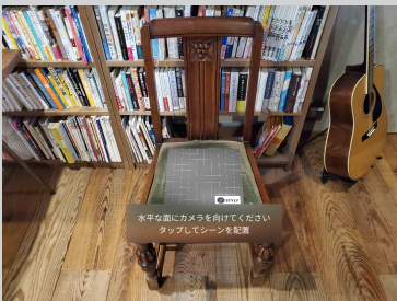
1. 水平な面にカメラを向け作品の展示場所を決める