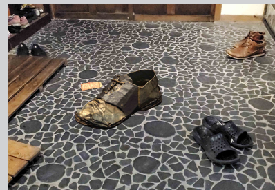
3. 端末を動かしながら、様々な方向から作品を鑑賞する