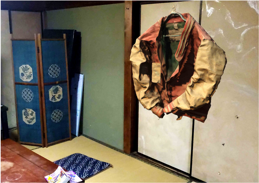
鈴木一太郎「おうちに居ながら」美術館」2020年、参考写真3（使用作品：日比野克彦《SWEATY JACKET》1982年）