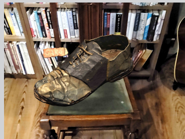
2. 画面をタップすると作品が現れる