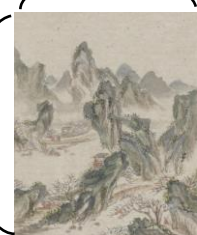
《極密山水小帖》個人蔵