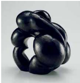
林康夫《雲》1948年 京都国立近代美術館蔵