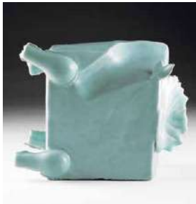
鈴木治《天馬機轉》1973年 岐阜県現代陶芸美術館蔵