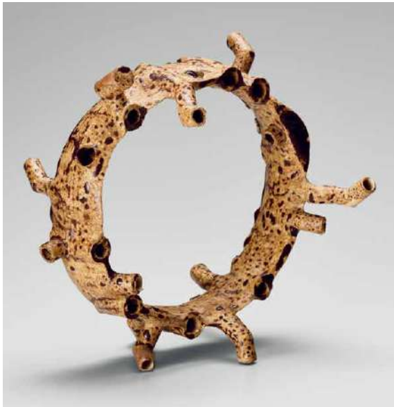
八木一夫《ガムザ氏の散歩》1954年 京都国立近代美術館蔵

本展は走泥社の意義や意味を再検証しようとする中で、とりわけ前半の25年間に焦点を当てています。50年という走泥社の活動期間全体を見渡した時、日本陶芸史におけるその革新性は特に前半期に認められ、1960年代半ば以降、例えば1964年の現代国際陶芸展を皮切りに海外の動向が日本でも紹介されるようになると、走泥社の「前衛性」は次第に相対化されていきます。そこで本展では、走泥社結成25周年となる1973年までを主な対象とし、同時期に前衛陶芸運動を展開した四耕会や彼らに影響を与えた走泥社以外の作家も加え、前衛陶芸が生まれた時代を振り返ります。