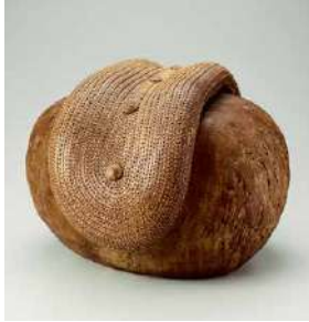
熊倉順吉《風人'67'》1967年 京都国立近代美術館蔵