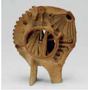
辻智堂《時計》1956年 京都国立近代美術館蔵