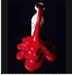
三輪龍作《LOVE》1969年 高松市美術館蔵