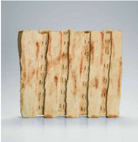
山田光《窓》1966年 京都国立近代美術館蔵