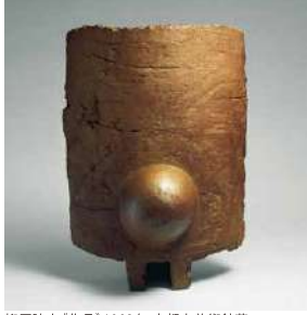
柳原睦夫《作品》1963年 京都市美術館蔵