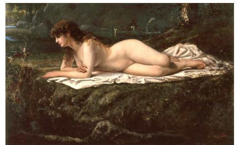
山本芳翠《裸婦》1880年頃 岐阜県美術館収蔵 【重要文化財】